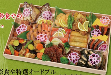
彩食や特選オードブル 5~6名様 10,800円