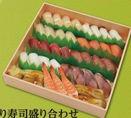
握り寿司盛り合わせ 4,320円