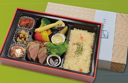
彩食や幕の内弁当 1,080円より