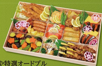
彩食や特選オードブル 5~6名様 5,400円