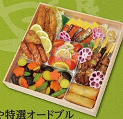
彩食や特選オードブル 3~4名様 3,240円