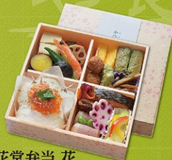
松花堂弁当 花 1,080円