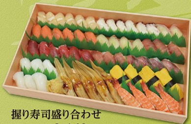
握り寿司盛り合わせ 8,640円