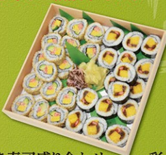
巻き寿司盛り合わせ 2,480円